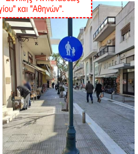
Ενδεικτικό παράδειγμα σηματοδότησης (P55) πεζοδρομίου στο Δήμο Τρικυλλίων.