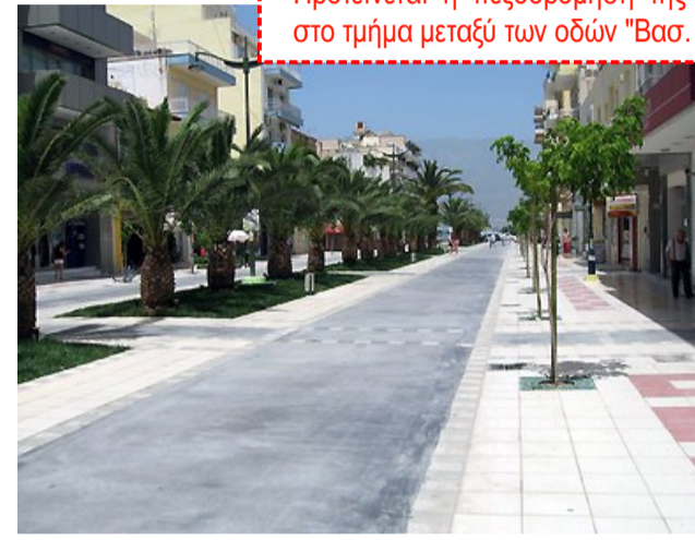
Ενδεικτικό παράδειγμα πεζοδρομίου στο Δήμο Κορνθίων.

Προτείνεται η πεζοδρομική της οδού "Εθνικής Αντιστάσεως" στο τμήμα μεταξύ των οδών "Βασ. Γεωργίου" και "Αθηνών".