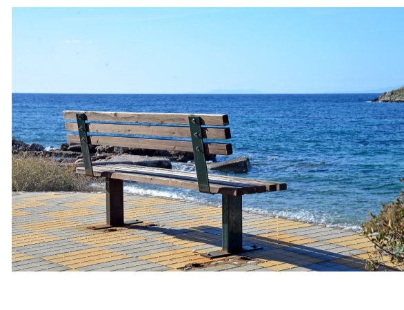
Ενδεικτική απεικόνιση καθιστικού εξοπλισμού.

Προτείνεται η πεζοδρομική της οδού "Εθνικής Αντιστάσεως" στο τμήμα μεταξύ των οδών "Βασ. Γεωργίου" και "Αθηνών".