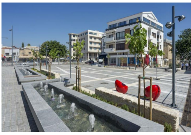
Ενδεικτικό παράδειγμα πλατείας στο Δήμο Λεμεσού.

Προτείνεται η ανάπλαση κοινόχρηστων χώρων, που έως και σήμερα δεν έχουν υλοποιηθεί, στο πλαίσιο της αστικής αναζωογόνησης. Παράλληλα προτείνεται η κατάλληλη διαμόρφωση των οδών πλησίον των Κ.Χ. για την ομαλή και ανεμπόδιση προσέγγιση αυτών καθώς και την ηθιοποίηση της κυκλοφορίας.