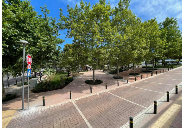
Ενδεικτικό παράδειγμα πλατείας και διαμορφώσεων σε ερπαιόμενη οδό στο Δήμο Βάρης-Βούλας-Βουλιαγμένης.