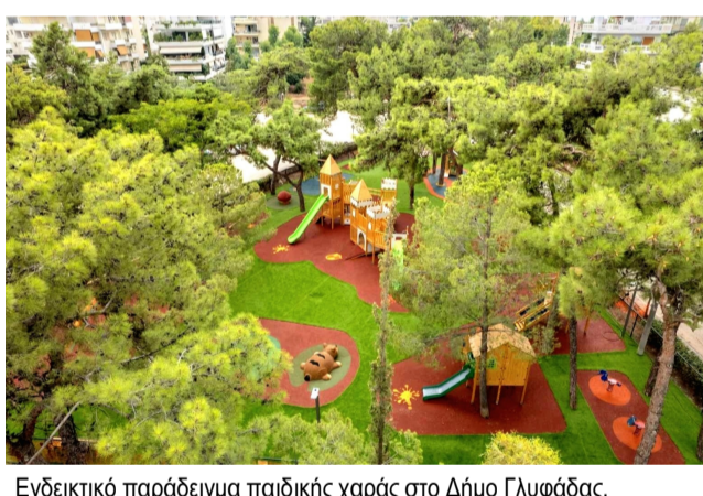
Ενδεικτικό παράδειγμα παιδικής χαράς στο Δήμο Γλυφάδας.