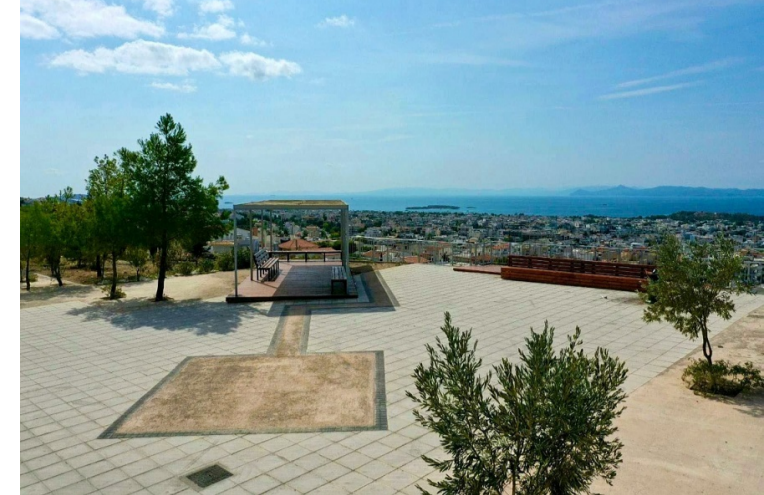
Ενδεικτικό παράδειγμα σημείου ξεκούρασης και αναψυχής στο Δήμο Γλυφάδας.

Αξιοποίηση του ΟΤ40 που προβλέπεται από την τροποποίηση και επέκταση του ρυμοτομικού (ΦΕΚ 65/Δ/1970) ως κοινόχρηστος χώρος - Άλσος. Έξταση της εφικτότητας δημιουργίας σημείου ξεκούρασης και αναψυχής στο πρότυπο του "μπαλκονιού" της Γλυφάδας.