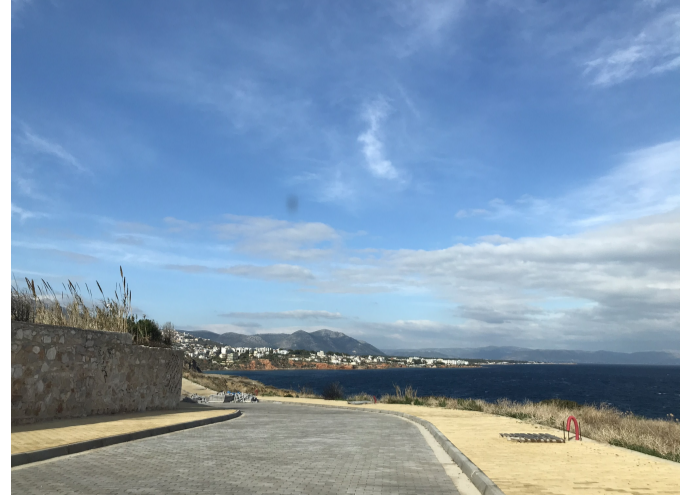
Παραλιακός διάδρομος.

Προτείνεται η προσθήκη καθιστικού εξοπλισμού στο τμήμα ανάπλασης του παραλιακού διαδρόμου, για τη δημιουργία "σημείων θέσεως και ξεκούρασης" των περπατητών.