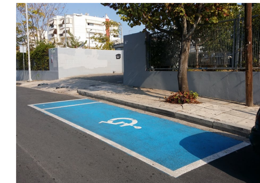
Ενδεικτικό παράδειγμα θέσης στάθμευσης ΑμεΑ.