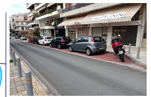
Ενδεικτικό παράδειγμα εγκαθιτισμού θέσεων στάθμευσης.

Εγκαθιτισμός στάθμευσης στην πλειονότητα των παρειών που εφαρμόζεται το ΣΕΣ με την προϋπόθεση ότι οι συνθήκες προσβασιμότητας το επιτρέπουν, αναφορικά και με τις προτεινόμενες παρεμβάσεις ΣΑΠ. Το μέτρο θα ενισχύσει σημαντικά και την ασφάλεια των πεζών στις διασταυρώσεις, ενώ μειώνεται παράλληλα και η ταχύτητα των εισερχομένων οχημάτων σε αυτές.