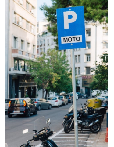
Ενδεικτικό παράδειγμα στάθμευσης δικύκλων.