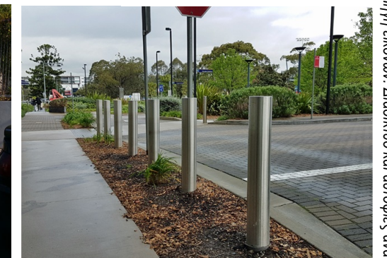
Ενδεικτικό παράδειγμα: κολωνάκια κατά μήκος του πεζοδρομίου.